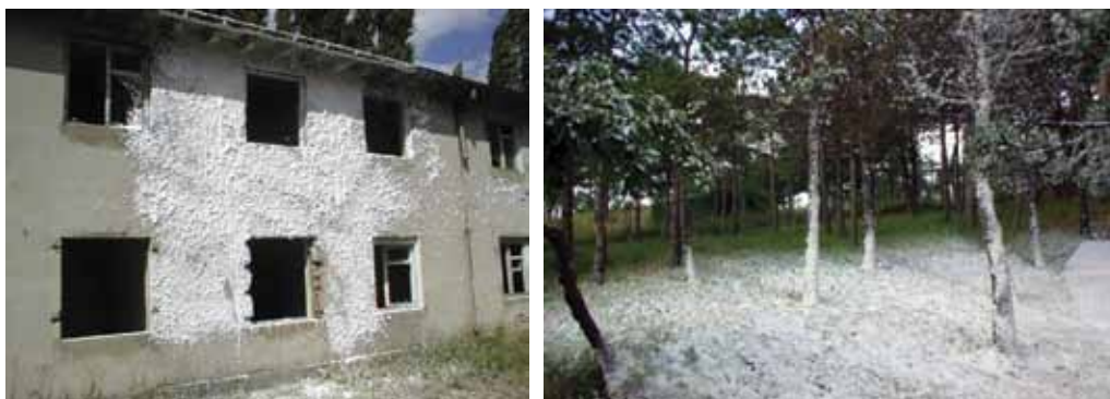
Slika 2. Prijanjanje pjene dobivene CAFS-om na vertikalnu površinu i na vegetaciju