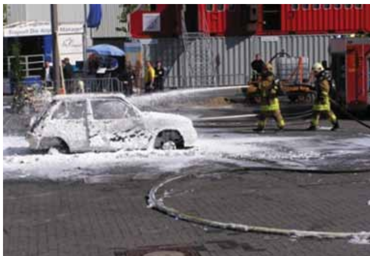
Slika 3. Gašenje požara osobnog vozila komprimiranom pjenom

Požare osobnih vozila i vozila za prijevoz putnika treba sagledavati kroz dva segmenta: gašenje požara i evakuaciju putnika. Govoreći o gašenju vozila u kojima se nalaze osobe, treba voditi računa o vrsti mlaza kojime će se voda ubacivati u vozilo zahvaćeno požarom. Široko raspršeni mlaz ili vodena magla, osim što djeluju ohlađujuće, dobrim djelom djeluju i ugušujuće, naročito vodena magla koja može oduzeti kisik osobama u vozilu. Pjena se rijetko primjenjuje kod manjih "svakodnevnih" požara osobnih vozila. Razlog tomu leži i u vremenu potrebnome da se uspostavi mlaz za klasično dobivanje pjene. Pojavom tlačnih vitala za brzu navalu s mogućnošću dobave pjene preko visokog pritiska, te pojavom CAFS-a, povećava se primjena pjene i kod manjih požara. Poznato je da automobilska industrija u želji za praćenjem trendova razvoja mehanike, elektronike, a poglavito ergonomije, poseže za raznim sintetičkim materijalima kod kojih voda neće predstavljati idealno rješenje za gašenje, a sam proces gašenja će biti dugotrajan. Primjenom pjene za gašenje ove vrste požara skraćuje se vrijeme potrebno za gašenje, a pjena na principu prekrivanja oduzima kisik potreban za gorenje i ugušuje požar, slika 3.